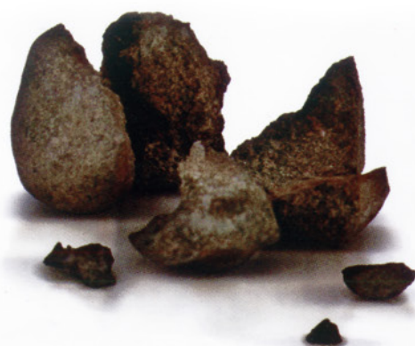
Οι μολύνσεις του ουροποιητικού συστήματος μπορούν να δημιουργήσουν πέτρες